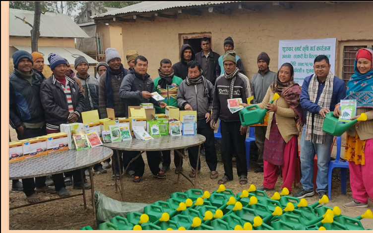
शुक्रबार स्मार्ट कृषि गाउँ कार्यक्रम घोरहीमा तरकारी बीउ तथा सामग्री वितरण

यसै गरी बालीगत उन्नतका विउहरुको गर्ने प्राविधि कृषकमा विकास गरिएको छ । धान तथा मकैको क्षेत्रमा विदेशी हाइब्रिड जातलाई प्रतिस्थापन गर्दै नेपाली जातको हाइब्रिड बिउ प्रयोग गर्न प्रोत्साहन गरिएको छ । पशुपंछीमा भ्याक्सिन सेवा दिने काम भएका छन् भने बीमाका लागि आवश्यक सहजिकरणको पनि काम भएका छन्। आ.व. २०७८/७९ मा १२९०६ वटा पशुहरुमा पिपिआर खोप, २८९६ पशुहरुमा खोरेत रोगको खोप र १९२ पन्छीहरुमा रानीखेत खोप कार्यक्रम मार्फत लगाइएको थियो।