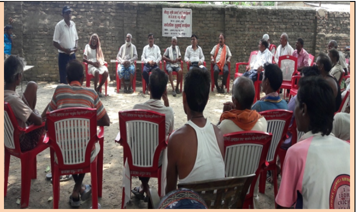
सौरहा स्मार्ट कृषि गाउँ कार्यक्रम कपिवस्तु न.पा.-१२ मा कार्यक्रमको सार्वजनिक सुनुवाई कार्यक्रम

समग्रमा हेर्दा सबै सम्भागमा राम्रो काम भएको र विशेषतः कृषि तर्फ सिँचाई सम्भागमा धेरै राम्रो काम भएको देखिन्छ भने पशुपंछी तर्फ नमुना गोठ/खोर निर्माणमा राम्रो काम भई सुरक्षित र स्वस्थ दुध/मासु उत्पादन सूनश्चित गरिएको छ । अन्य सबै काम राम्रो भएर पनि हाम्रो कामहरुको उपलब्धीहरुको प्रतिवेदन तयारीमा अझै ध्यान पुगेको छैन । उपलब्धी प्रतिवेदन नै नपठाउने भेटेरीनरी अस्पताल तथा पशु सेवा विज्ञ केन्द्र, बाँके र एकिकृत कृषि तथा पशुपंछी विकास कार्यालय, प्युठानको उपलब्धी अझ समावेश गर्न सकिएको छैन ।