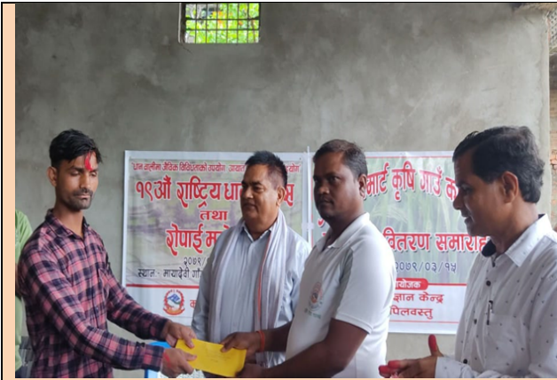
लोहरौला स्मार्ट कृषि गाउँ कृष्णनगर न.पा.-८ मा उत्कृष्ट कृषक पुरस्कार वितरण कार्यक्रम

पारिश्रमिक दीइएकोले कार्यक्रम संचालन गर्न सजिलो भएको छ। बालीगत विभिन्न बालीको स्थलगत तालिमले कृषकलाई सानो सानो व्यवस्थापनका त्रुटिमा सुधार गर्न सहयोग पुगेको छ।