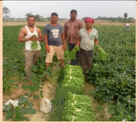
दोगहरी कृषि स्मार्ट गाँउ कार्यक्रम, सि.न.न.पा-१०, दोगहरी, रुपन्देहीमा तरकारी उत्पादन