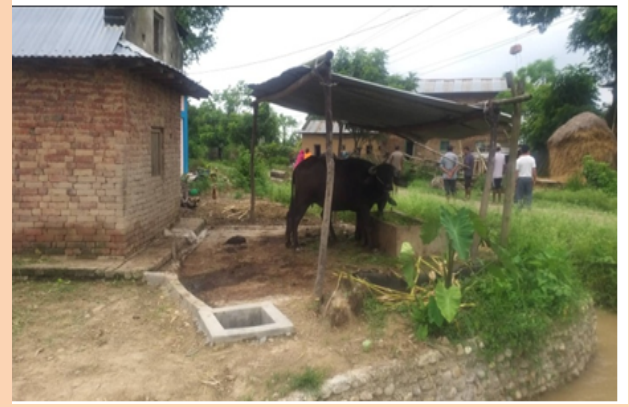
स्मार्ट कृषि गाउँ कार्यक्रम, गेरुवा गा.पा.-०४, गोकला, पशु आहाराका लागि एजेला